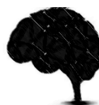
UX et Game design ( The Gamer's Brain , etc...)